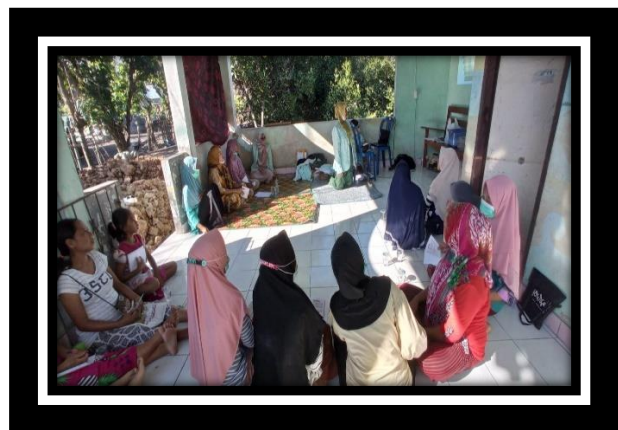
Gambar 1. Dokumentasi kegiatan penyuluhan pemanfaatan buku saku anemia pada ibu hamil dalam upaya pencegahan anemia pada ibu hamil